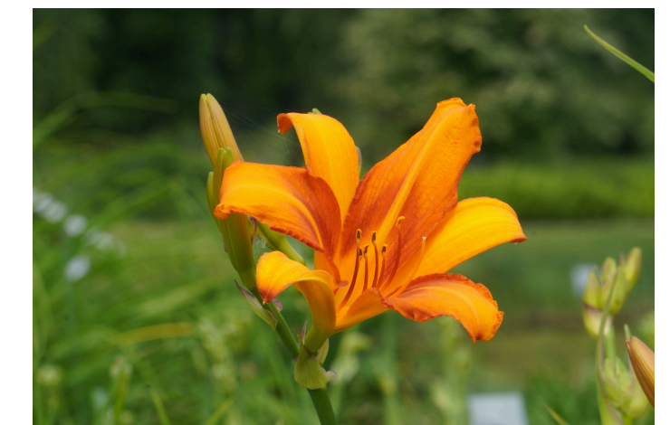
Viendienė ( Hemerocallis ) 'Tiorkin'