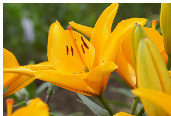
Lelija ( Lilium ) 'Inka'