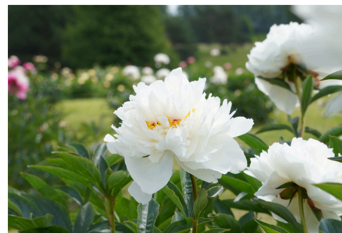
Puikusias bijūnas ( Paeonia lactiflora ) 'Maman Millet'