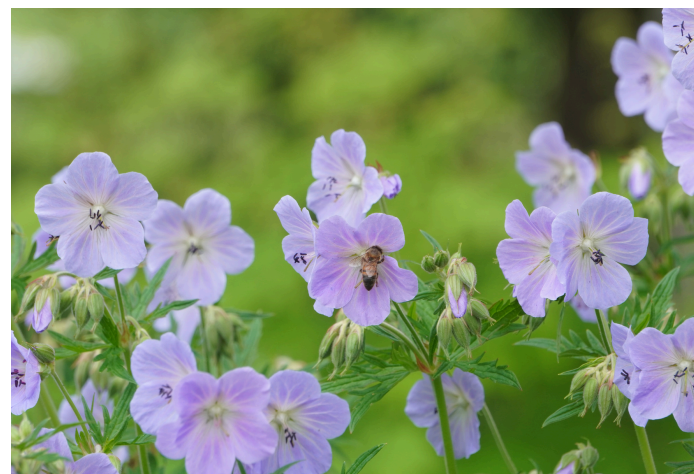
Snaputis ( Geranium ) 'Istrica'