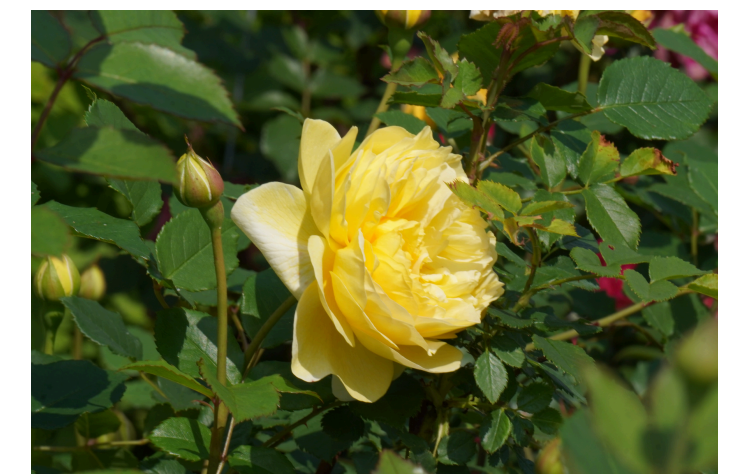
Rožė ( Rosa ) 'The Poets Wife'

Taip pat kviečiame atrasti dekoratyvinių varpinių augalų kolekcijas ir pasigrožėti gausia natūralios floros įvairove visoje sodo teritorijoje.